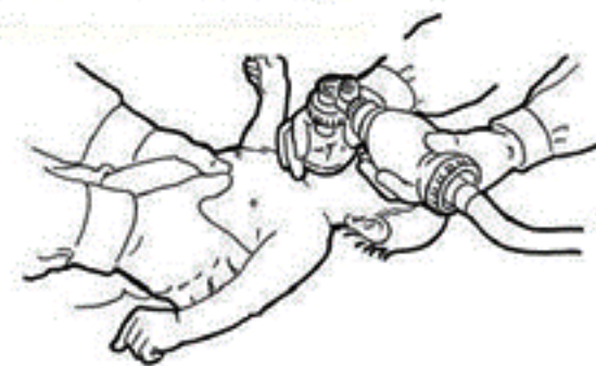
A l'aide des 2 pouces