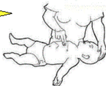
A l'aide de 2 doigts d'une main